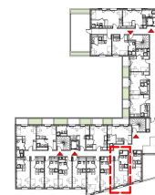
Plan de repérage / niveau 6